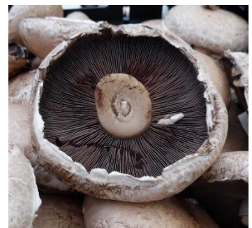
Das sind Lamellen.